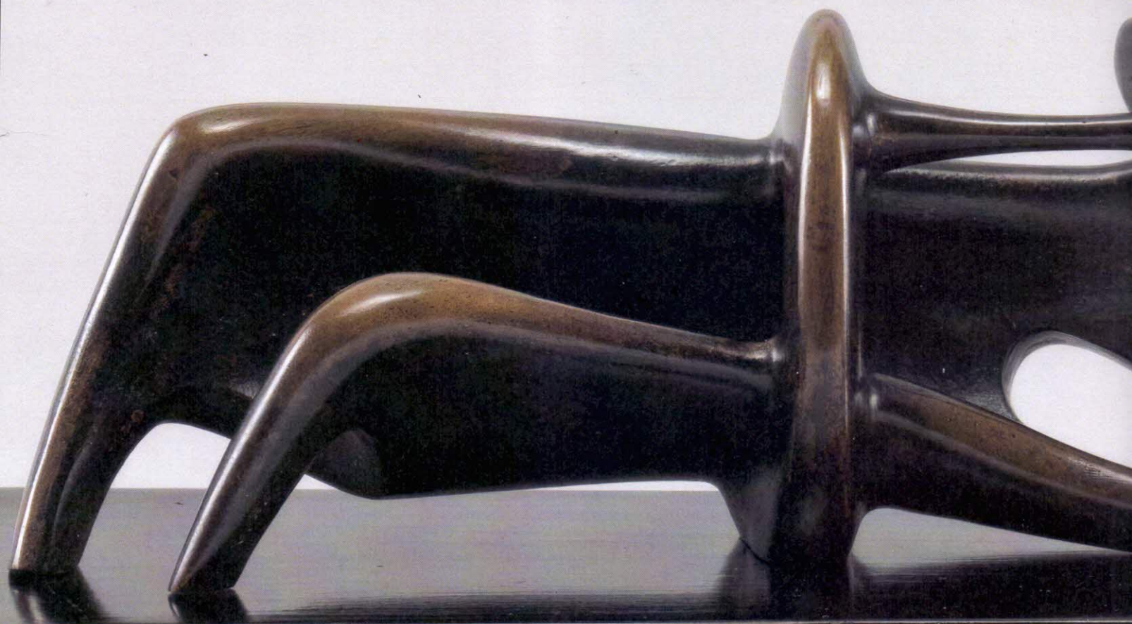
Генри Мур Полулежащая фигура, 1985 г.