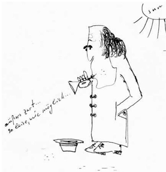
Без названия: Автопортрет

Немало молодых ребят яркими метеоритами пронеслись на композиторском небосклоне и... сгорели, входя в плотные слои атмосферы повседневной музыкантской жизни. Выживают не просто талантливые, а те, чей та-