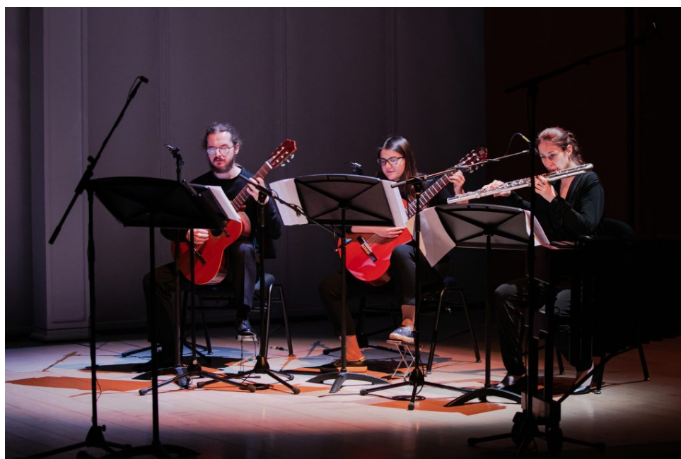
Солисты ансамбля «Студия новой музыки»