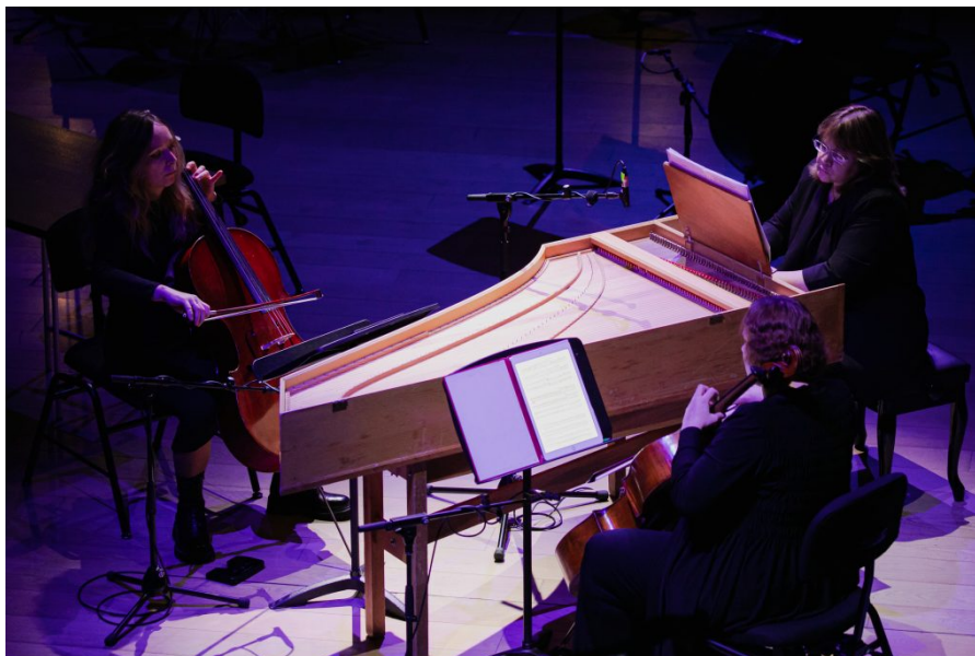
Солисты ансамбля «Студия новой музыки»